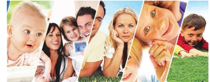
A.D.A.D. Association Départementale d'Aide familiale à Domicile

NOS BUREAUX SONT OUVERTS du lundi au jeudi de 8h à 12h00 et de 14h00 à 18h et le vendredi de 8h à 12h00 et de 14h00 à 17h30